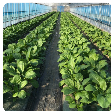
12月 アスパラ菜栽培