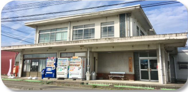
米ファーム斐太 事務所 外観